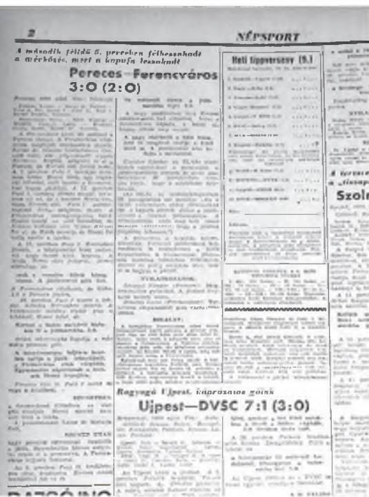
A Népsport beszámolója a mérkőzésről...

ket. A nyíláson keresztül homok ömlött a kocsiba, nem volt menekülési lehetőség. Várni kellett a mentőalakulatot. Megvirradt, mire mentő bányásztársaim a kocsihoz értek, mint később kiderült, 71 méter vizes-sáros földet kellett eltávolítaniuk, hogy a kocsihoz érhessenek”.