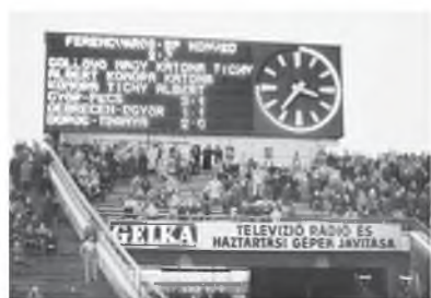
A nagytábla a játéknapi eredményeivel

Szepesi György 6:1-nél azt kiáltozta a mikrofonba, hogy „azok, akik ott-hon hallgatják a rádiót, jöjjenek ki a Népstadionba, ilyen futballt ritkán látni, és még több mint fél óra hátravan!”