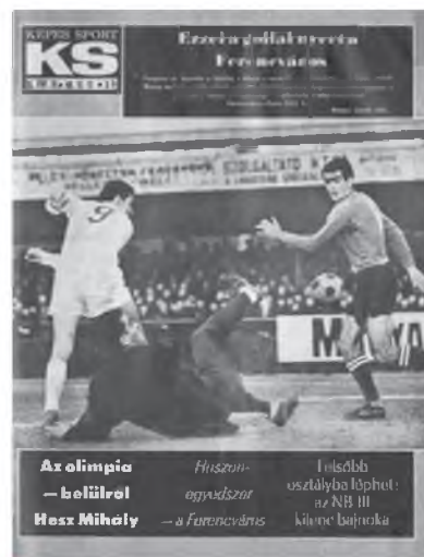
A Képes Sport bravúrfelvétele a bajnokságot eldöntő gólról