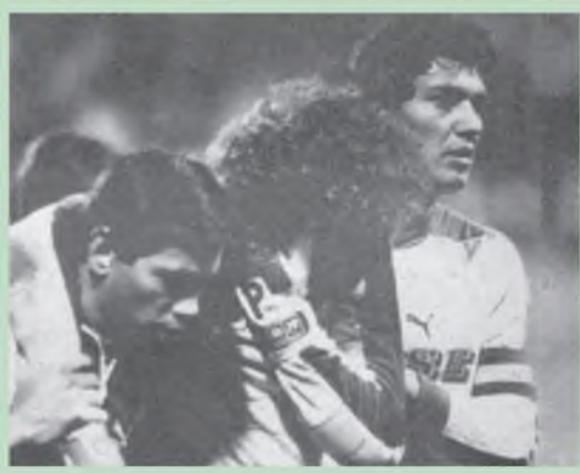
A Képes Sportban Farkas József képriportja idézte fel a legizgalmasabb jeleneteket