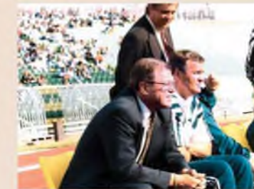
Amikor már szemüvegre volt szüksége ahhoz, hogy egy igazán jó Fradit lásson