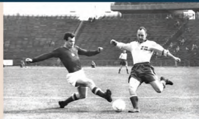
Útban Tokió felé. A svédek elleni budapesti selejtezőn nem hagyta fickándozni a vendégek balszélsőjét. Nyertünk is 4:0-ra.

Képzettsége hátvéd letére a kor legjobb csataraival vetekedett, helyezkedésben nem nagyon akad párja a világon, lövőerejét pedig talán még az „ágyúlábú” Deák Bamba is megirigyelhette volna.