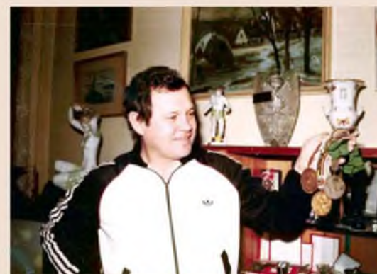
A világ legeredményesebb olimpiai futballjátékosa! Egy bronz és két aranyérem.

A Ferencváros történetének egyik legeredményesebb edzője, 335-ször ült a zöld-fehérek kispadján (ebből 179 NB I-es mérkőzésen), 3 arany-, 3 ezüst-,