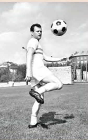
Dezsőnék hátvéd letére külsővel dekázni nem okozott különösebb problémát