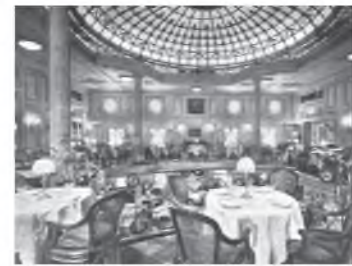
Így festett a Giulio Cesare szalonja

Tizenkét napos ringatózást követően kötött ki a közben szinte kivétel nélkül a tengeri betegség kellemetlen érzésével is megismerkedő játékosokkal a Giulio Cesare a távoli Rio de Janeiro kikötőjében. Ezernyi magyar, köztük a követ várta a küldöttséget, ezt csak azért érdemes megemlíteni, mert aztán az