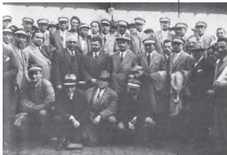
A teljes küldöttség Santos városának kikötőjében