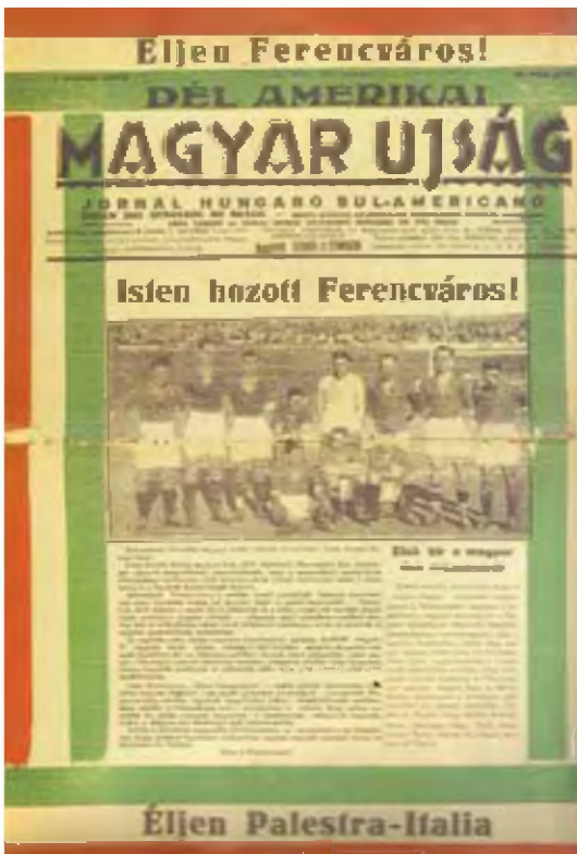
Így várta a Magyar Újság Dél-Amerikába a Ferencvárost