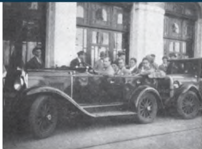
A brazilok megadták a módját a vendéglátásnak. Elegáns autókkal szállították a magyar futballistákat.

Ez már túl sok volt a futballjukra okkal büszke uruguayiaknak, akik még az első mérkőzésről hiányzó nagy csillagot, Andradét is bevetették a magas összegért kiharcolt visszavágón. Ugyan a kor egyik legjobb dél-amerikai bírója, az 1928-as olimpi-