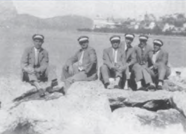
Formaruhás fradisták a tengerparton. Nagy feltűnést keltek a járőkelők között.