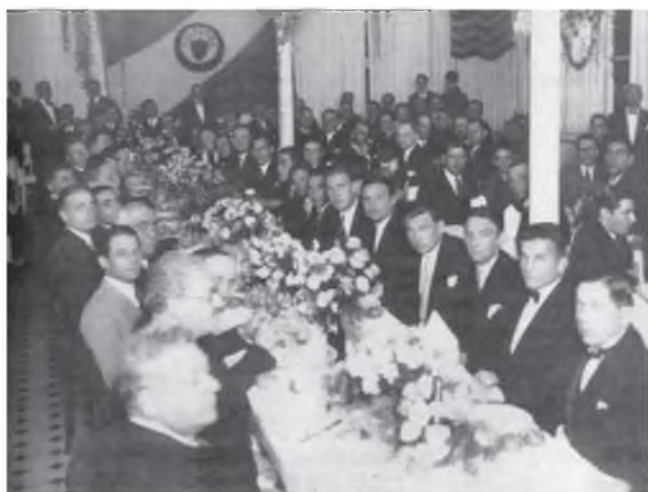
A zöld-fehérek a Palestra Italia bankettjén

Két héttel a Dél-Amerikába érkezés után visszaveszt a Ferencváros formája, holtpontra jutott a játékosok fizikai állapota, akklimatizálódási nehézségekkel küzdöttek. (Noha a portyalevelek egy részé-