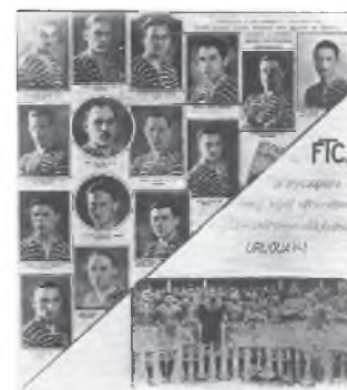
Unnapi összeállítás a hazaérkezés utáni sajtóból

A családtagokon, a barátokon kívül több ezer szurkoló várta a játékosokat, az MLSZ vezetői közül senki sem érezte fontosnak, hogy a pályaudvaron fogadja az egész Dél-Amerikában a magyar futballnak temérdek új hívet szerzett társaságot.